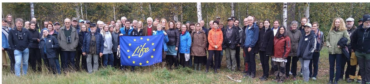
Foto av konferensdeltagarna som deltog i exkursionen till Gubbängen, dag 1.